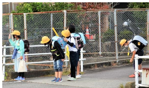
止まってくれた車にあいさつをする児童

たかが「あいさつ」、されど「あいさつ」。あいさつには人の心を動かす大きな力があると信じ、家庭で、地域で、学校で、子どもを取り巻く大人が異口同音に子どもたちにあいさつの大切さを伝えていってほしいと願っています。