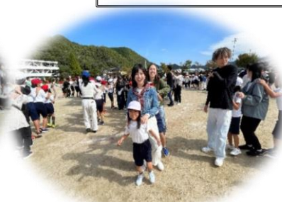
【地域種目 みんなで踊ろう！ジェンカ】